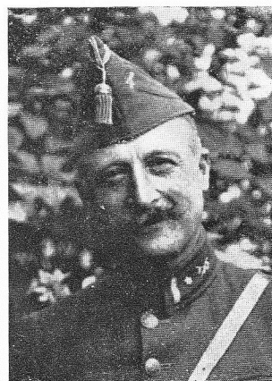
de WALCKIERS, vicomte Edouard, né le 6 janvier 1861, à Ath.

Après avoir brillamment participé à toute la campagne, trouva la mort des braves à Adinkerke, le 28 août 1918.